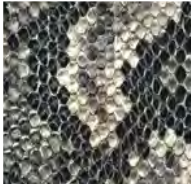
black & white F6321348