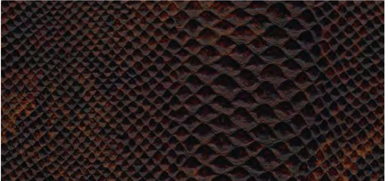
skai® Aythana N brandy F6321017

Un material skai® de alta calidad con una fiel estática de piel de serpiente. Su estampado fino y de alta precisión y su impresión de alto contraste en varios colores otorgan a este material toda la viveza de su motivo natural, una auténtica pitón.